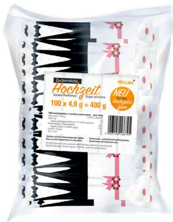
Zucker-Sticks "Hochzeit", Polybeutel