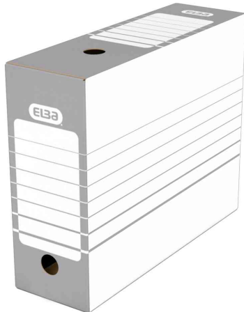
Archiv-Schachtel (B)100 mm