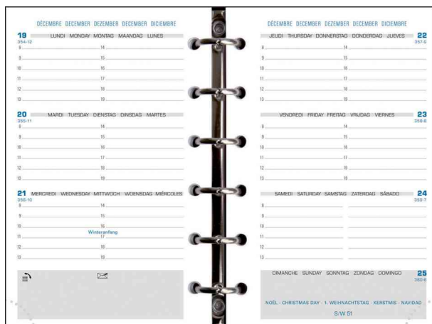
Visuel de référence: Recharge pour organisateur "Exatime 14", 2 pages/semaine