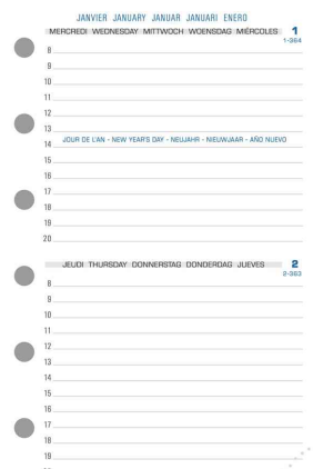
Recharge pour organisateur "Exatime 14", 2 jours par page