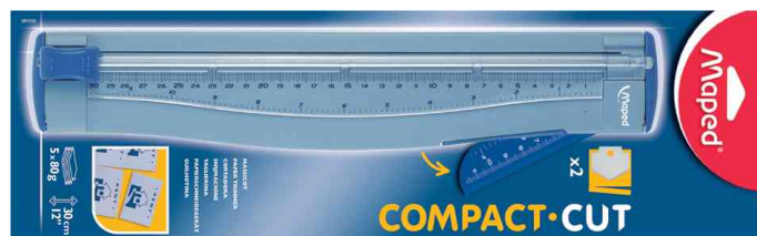
Rollen-Schneidemaschine "Compact Cut", Verpackung