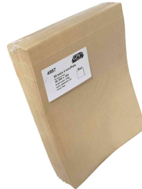
Symbolbid: Faltenversandtaschen fadenverstärkt - Großpackung