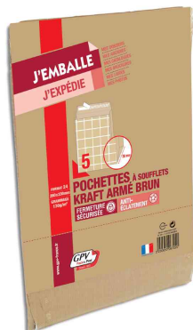
Symbolbid: Faltenversandtaschen fadenverstärkt