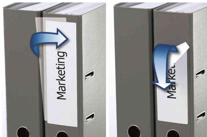
Orderrücken-Etiketten SPECIAL, Anwendung