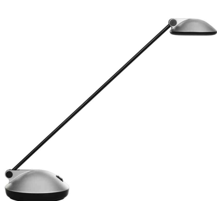
LED-Tischleuchte JOKER 2.0, grau