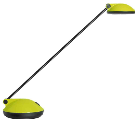
LED-Tischleuchte JOKER 2.0, grün