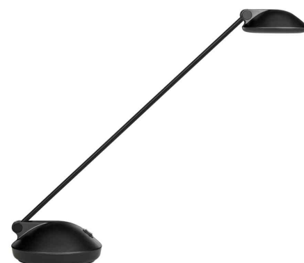
LED-Tischleuchte JOKER 2.0, schwarz