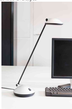
Zeigt das Produkt in der Anwendung