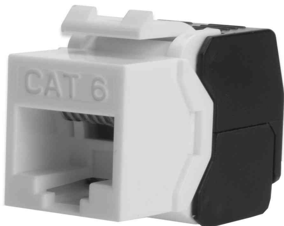
Keystone Modul Kat. 6, ungeschirmt