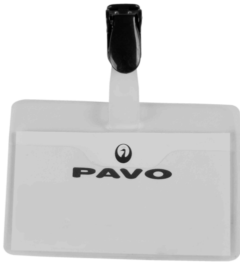
Namensschild aus Kunststoff, mit Clip,