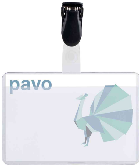
Namensschild aus Kunststoff, mit Clip