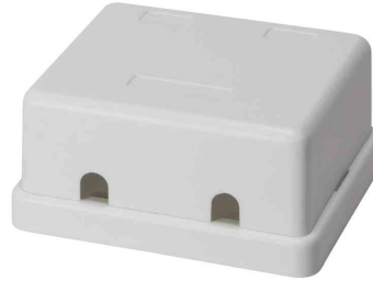
Keystone Aufputz-Leergehäuse, 2-fach, Rückansicht