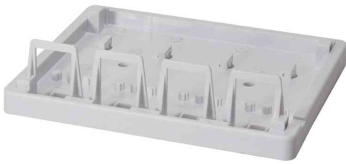
Keystone Aufputz-Leergehäuse, 4-fach, Detailansicht