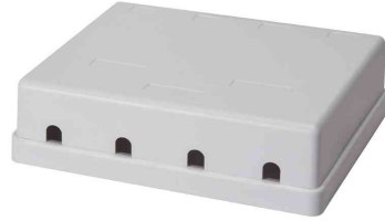
Keystone Aufputz-Leergehäuse, 4-fach, Rückansicht