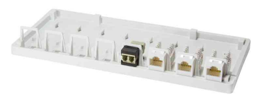
Keystone Aufputz-Leergehäuse, 8-fach, Anwendung