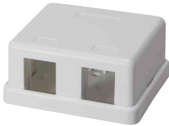
Keystone Aufputz-Leergehäuse, 2-fach

- schnelle und flexible Verkabelung im Netzwerk- oder Multimediabereich