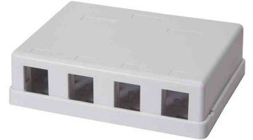
Keystone Aufputz-Leergehäuse, 4-fach