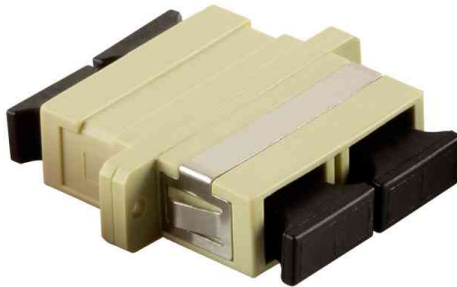
LWL Kupplung, 2 x SC Duplex, beige (OM1/2)