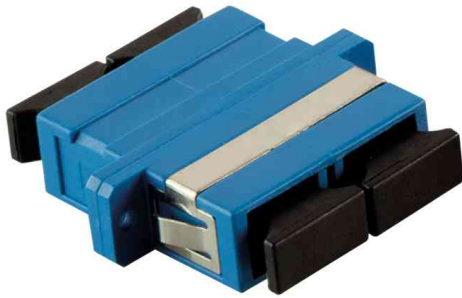
LWL Kupplung, 2 x SC Duplex, blau (OS1/2)

- eignen sich zur Montage in LWL Verteilern, Patchfeldern und Anschlussdosen