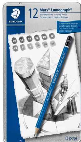
Bleistift Mars Lumograph, 12er Metalletui