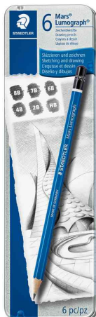
Bleistift Mars Lumograph, 6er Metalletui