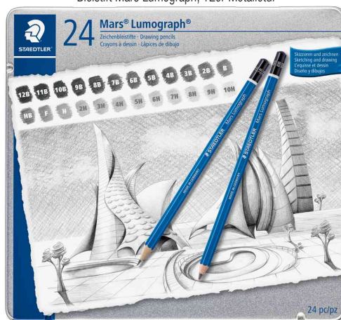
Bleistift Mars Lumograph, 24er Metalletui