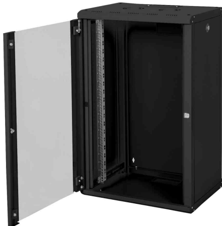
19" Wandverteiler Unique Line, 20 HE