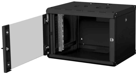
19" Wandverteiler Unique Line, 7 HE