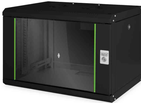
19" Wandverteiler Unique Line, 7 HE