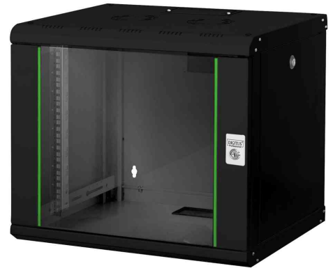
19" Wandverteiler Unique Line, 9 HE