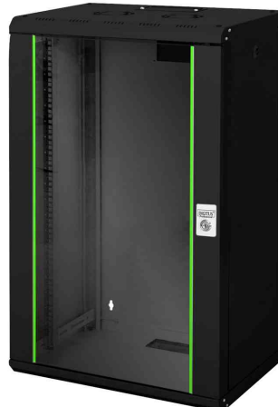
19" Wandverteiler Unique Line, 20 HE