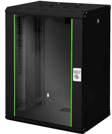
19" Wandverteiler Unique Line, 16 HE