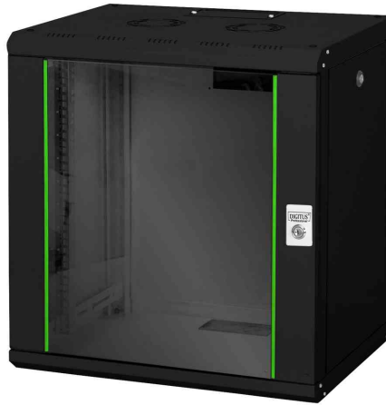
19" Wandverteiler Unique Line, 12 HE