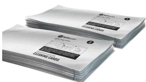
Reinigungsset für Geldschein-Prüfgeräte