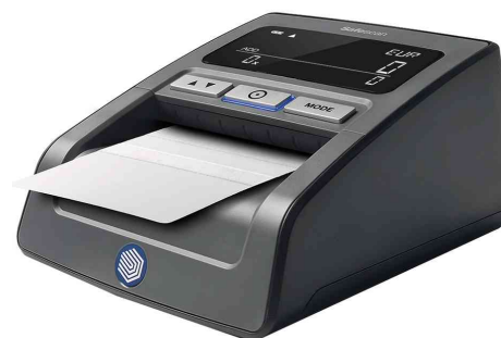
Reinigungsset für Geldschein-Prüfgeräte, Anwendung