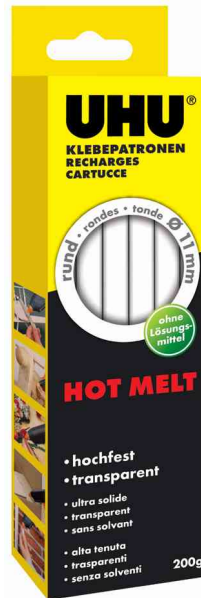
Zubehör - Heißklebepatrone Hot Melt, 200 g