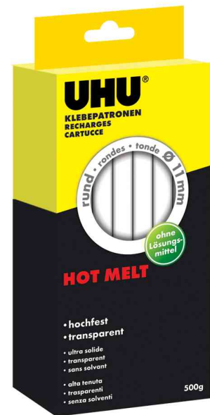
Zubehör - Heißklebepatrone Hot Melt, 500 g