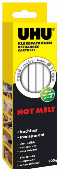
Zubehör - Heißklebepatrone Hot Melt, 200 g