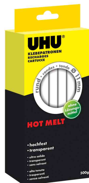
Zubehör - Heißklebepatrone Hot Melt, 500 g