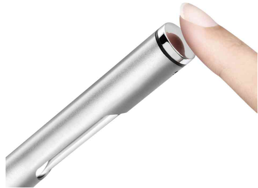
Detailansicht: Touchfeld-Bedienung am Leuchtenkopf