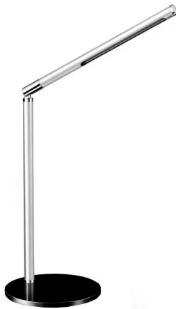
LED Tischleuchte CepPro, schwarz-metallgrau