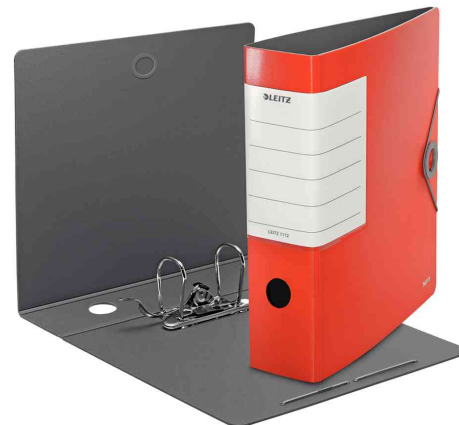
180° Ordner Solid, hellrot