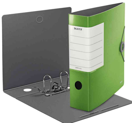
180° Ordner Solid, hellgrün