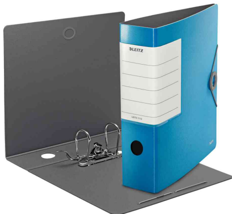
180° Ordner Solid, hellblau