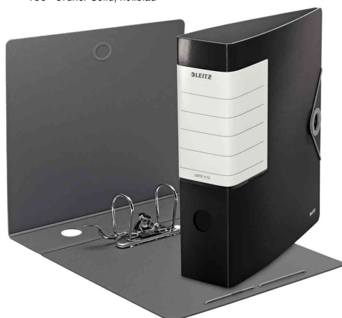
180° Ordner Solid, schwarz