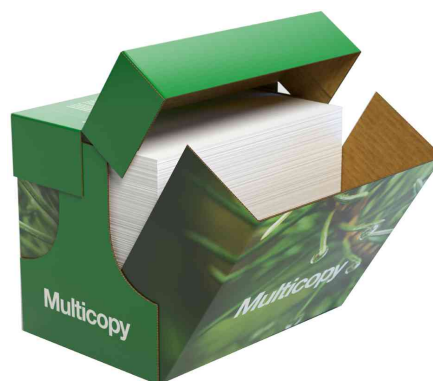
Multifunktionspapier MultiCopy, MaxBox