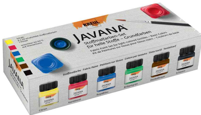
Textilfarbe JAVANA, Grundfarben-Set