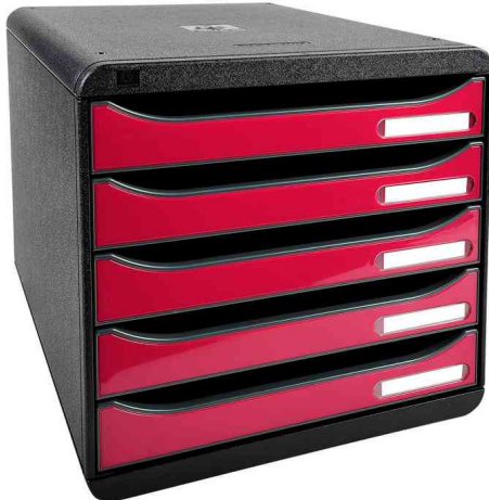
Schubladenbox BIG-BOX PLUS, schwarz / himbeer glänzend