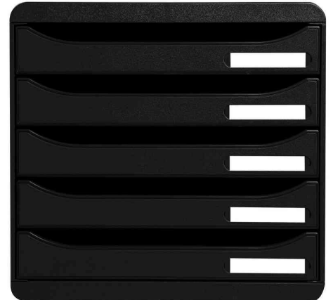
Schubladenbox BIG-BOX PLUS, schwarz