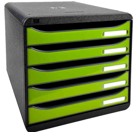
Schubladenbox BIG-BOX PLUS, schwarz / lemongrün glänzend