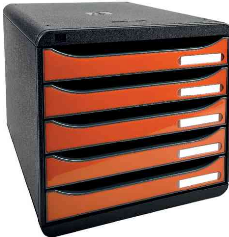
Schubladenbox BIG-BOX PLUS, mandarine glossy