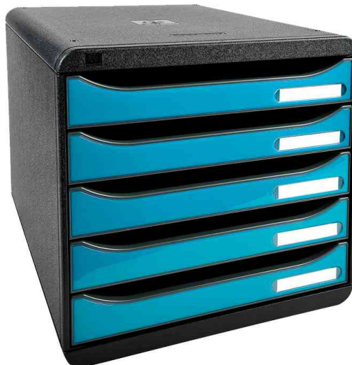
Schubladenbox BIG-BOX PLUS, schwarz / türkis glänzend