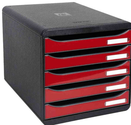
Schubladenbox BIG-BOX PLUS, schwarz / karminrot glänzend