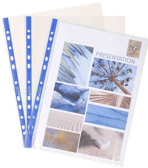
Prospekthülle Stop Doc, DIN A4