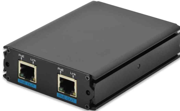
Fast Ethernet PoE+ Verstärker

- perfekte, kostengünstige und zeitsparende Lösung für die Sicherheitsüberwachung und für Netzwerkprojekte