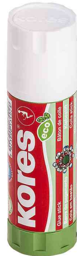
Klebestift "ECO", 40 g