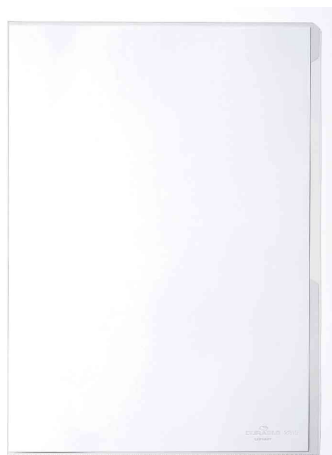
PREMIUM Sichthülle, glasklar