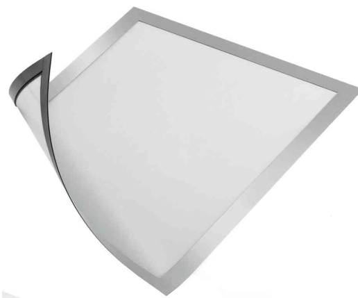
Magnet-Rahmen DURAFRAME MAGNETIC, silber