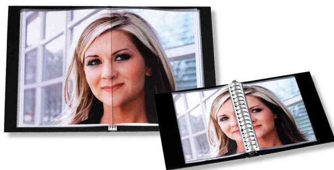
Vorteil: Blättern wie in einem Buch!