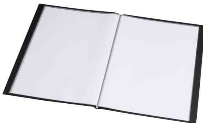
Sichtbuch "Original", DIN A5, offen