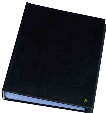
Sichtbuch "Original", DIN A5