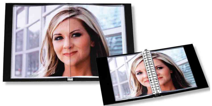
Vorteil: Blättern wie in einem Buch!