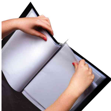
rillstab Mechanik: Einfacher Austausch der Hüllen