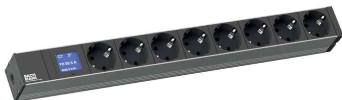
19" Steckdosenleiste "BlueNet BN0500"