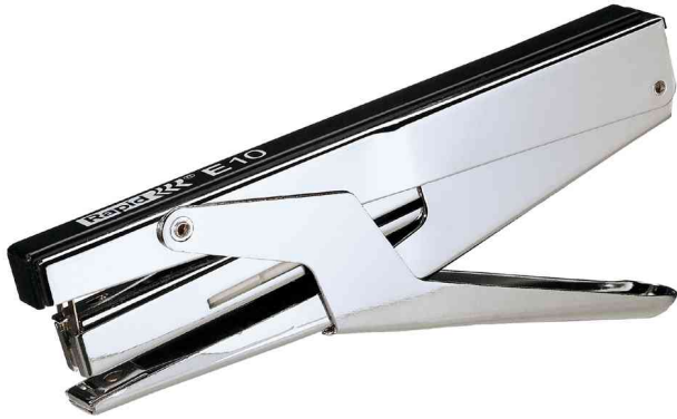
Heftzange Economy E10