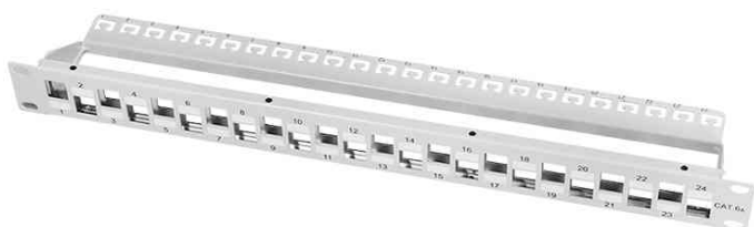
19" Keystone Patch Panel, 24 Port, lichtgrau