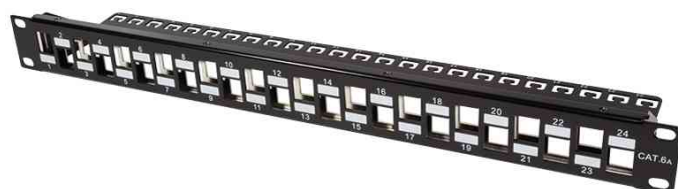
19" Keystone Patch Panel, 24 Port, schwarz