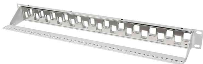
19" Keystone Patch Panel, 24 Port, lichtgrau, Rückseite