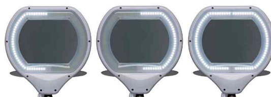
LEDs in 3 Bereichen dimmbar