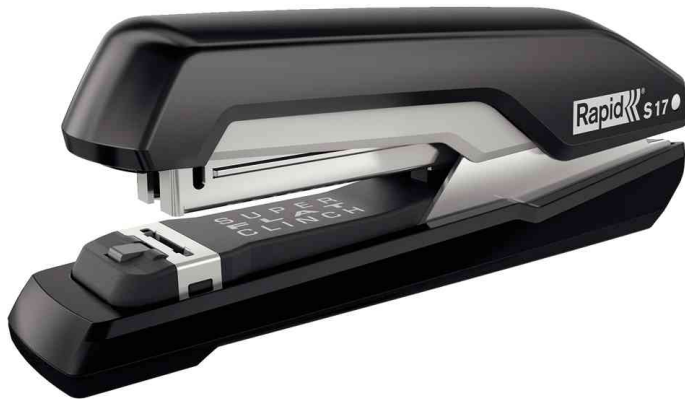
Heftgerät Supreme S17, schwarz / grau

- als Tisch- und Hand-Heftgerät geeignet