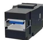
Zubehör: Keystone Jack HDMI