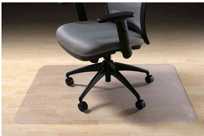
Bodenschutzmatte für Hartböden