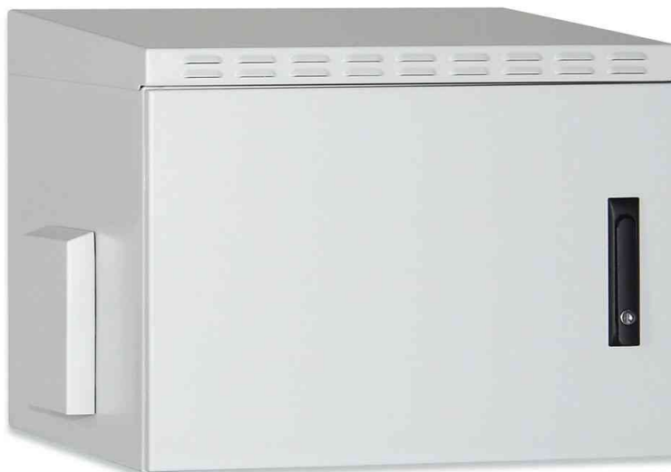
19" Wandverteiler OUTDOOR