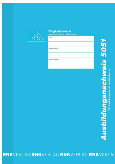
Ausbildungsnachweis-Heft 5051, wöchentlich