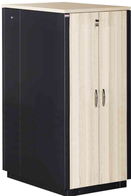
19" SOUNDproof Schrank, ahorn / schwarz