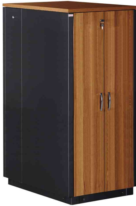
19" SOUNDproof Schrank, walnuss / schwarz