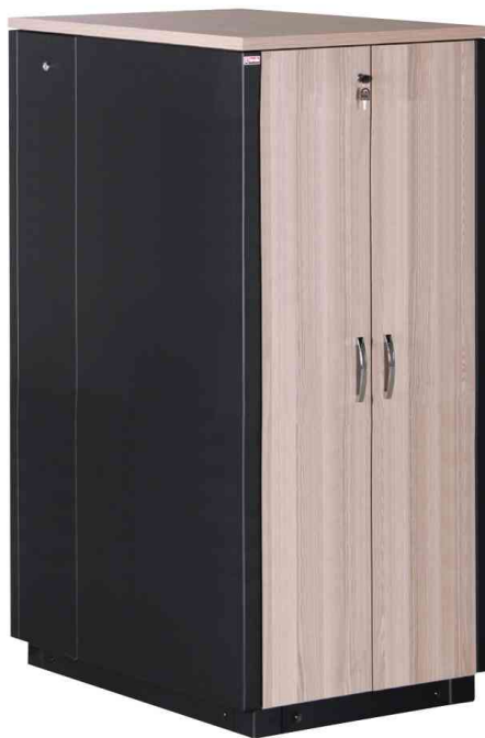
19" SOUNDproof Schrank, eiche / schwarz