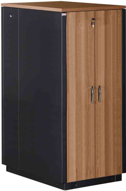
19" SOUNDproof Schrank, teak / schwarz