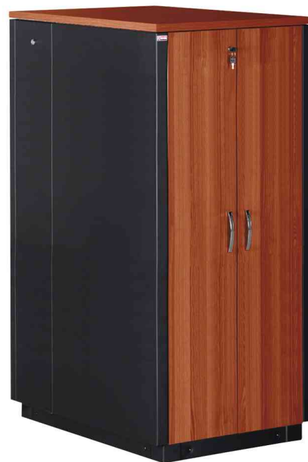
19" SOUNDproof Schrank, kirsche / schwarz