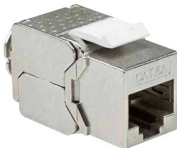
Keystone Modul Kat.6A, Klasse EA, geschirmt, schlanke Bauform