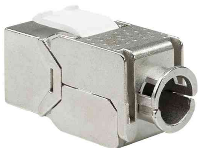
Keystone Modul Kat.6A, Klasse EA, geschirmt, schlanke Bauform