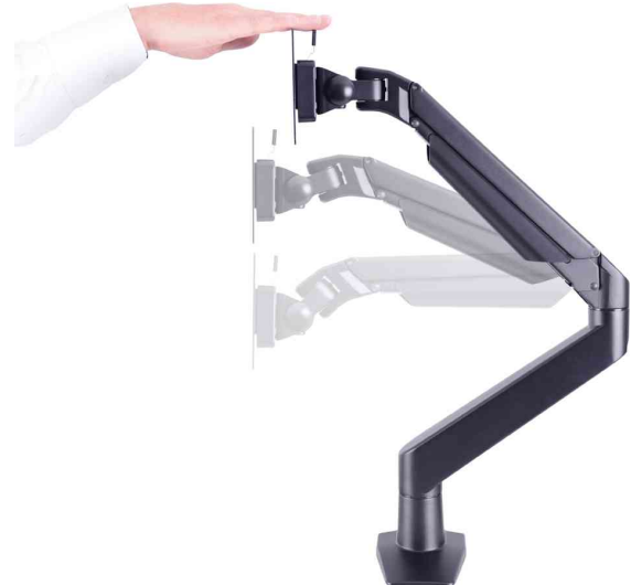
TFT-/LCD-Monitorarm Planeo Solo, Anwendung