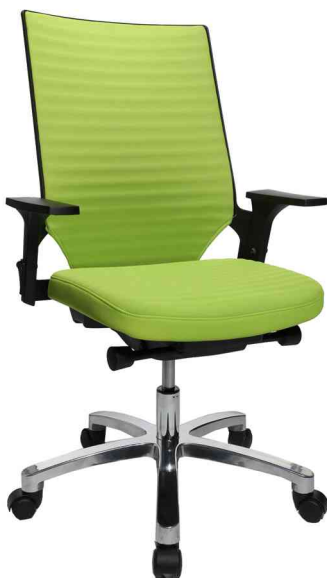
Bürodrehstuhl "Autosyncron 2", apfelgrün