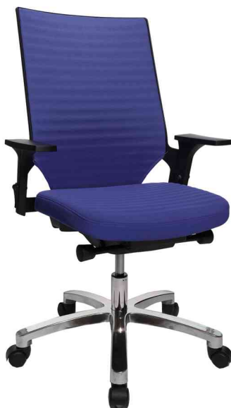
Bürodrehstuhl "Autosyncron 2", blau