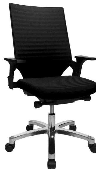
Bürodrehstuhl "Autosyncron 2", schwarz