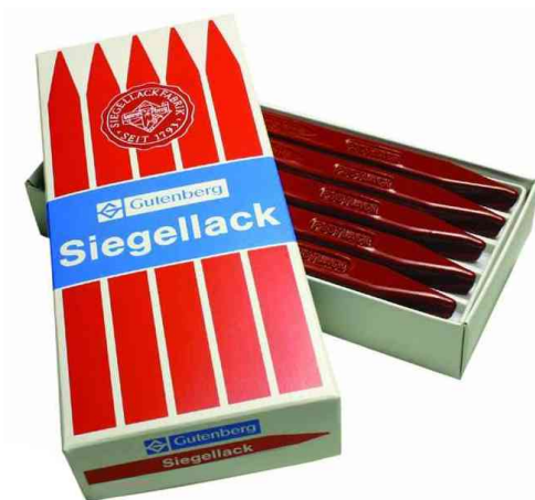
Siegellack Postlack, zinnoberrrot