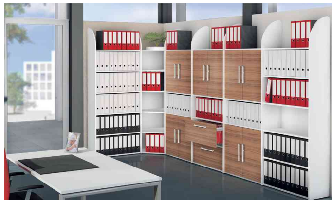
- Anwendungsbeispiel - mit Rückwand