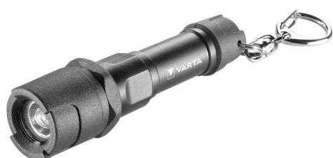
Taschenlampe "Indestructible Key Chain"