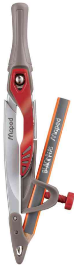
Zirkel Stop System