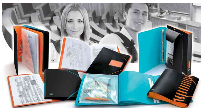
Serie For Students