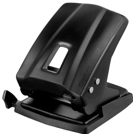
Locher Essentials E4044