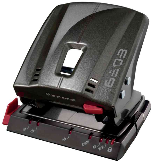
Locher Advanced A6303, taupe